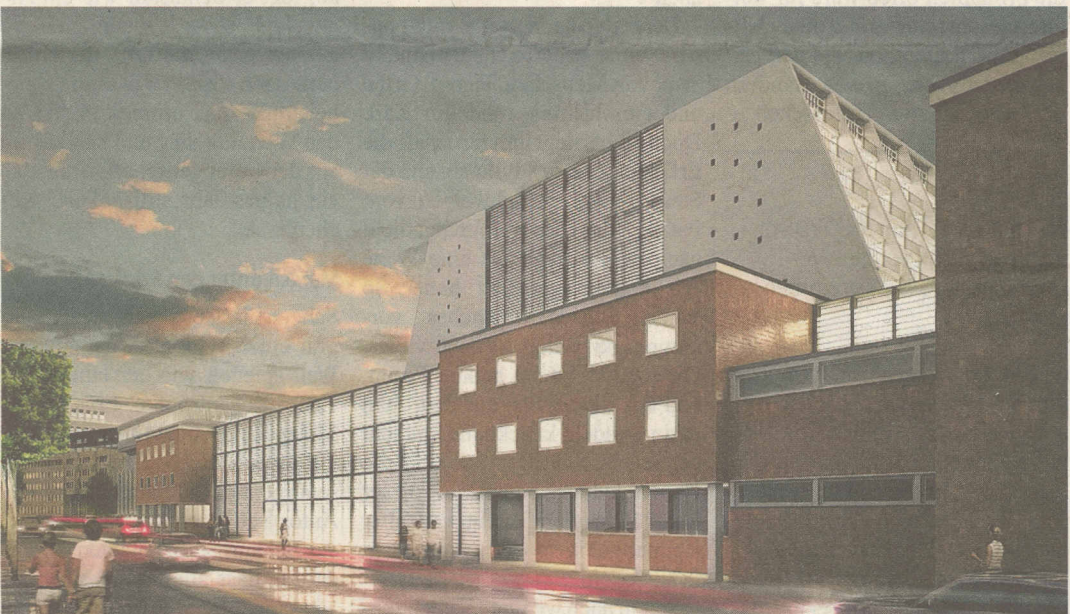
Drei Ansichten des Kölner Bühnenensembles, wie es sich 2015 präsentieren soll. Oben von der Nord-Süd-Fahrt aus gesehen, in der Mitte von der Brüderstraße, unten von der Krebsgasse.